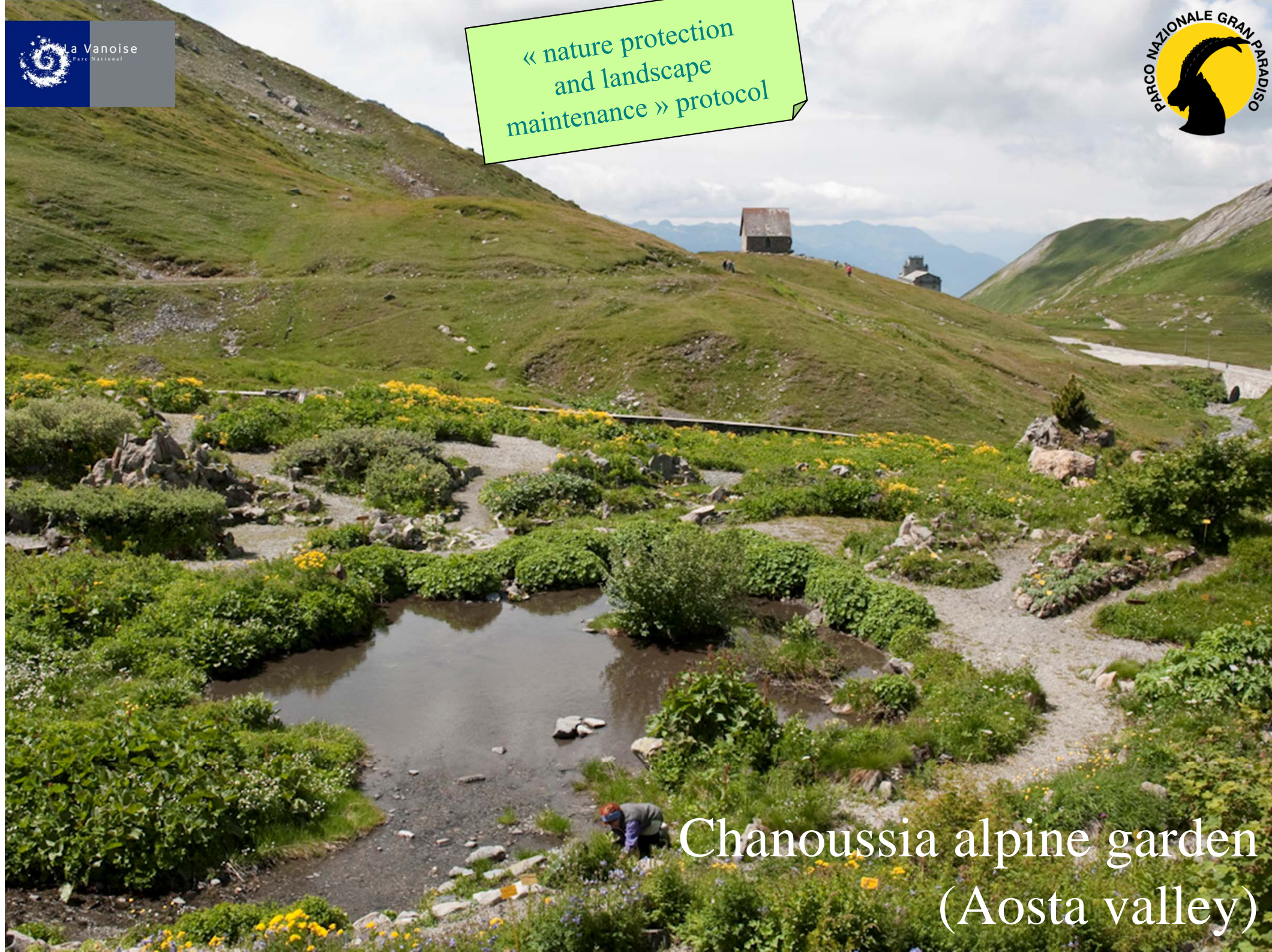
Chanoussia alpine garden (Aosta valley)