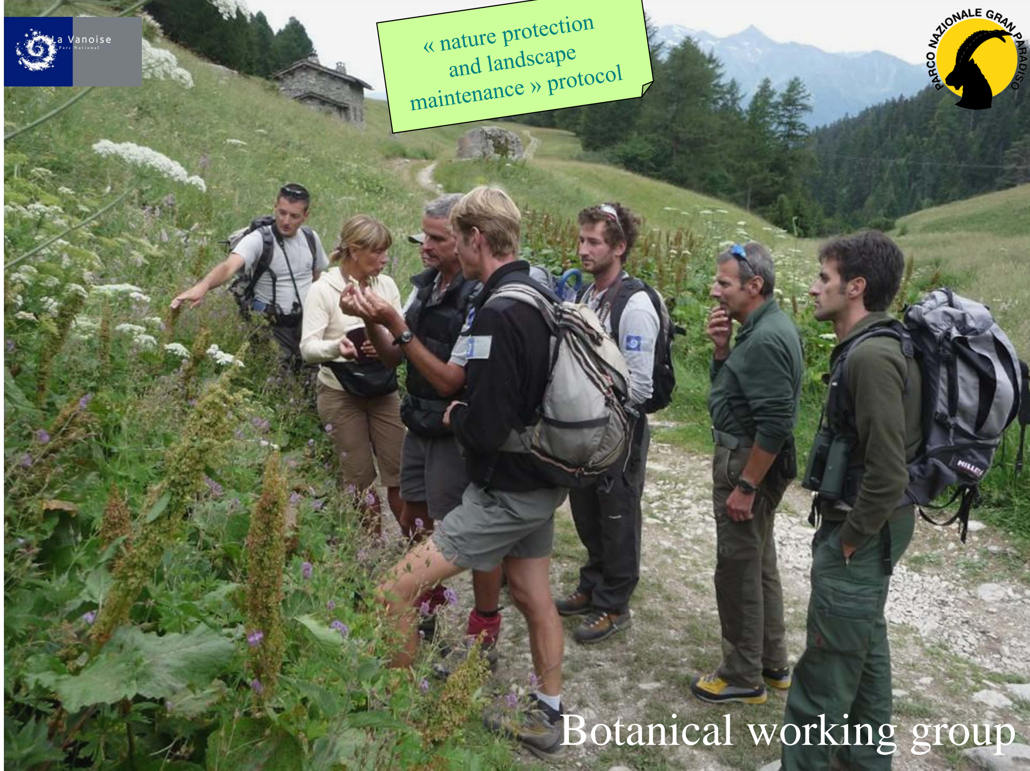
Botanical working group