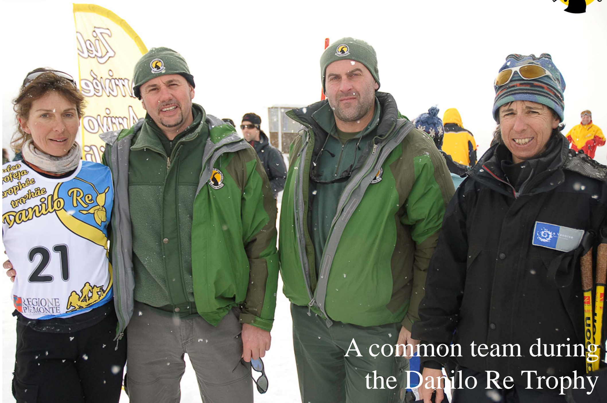
A common team during the Danilo Re Trophy